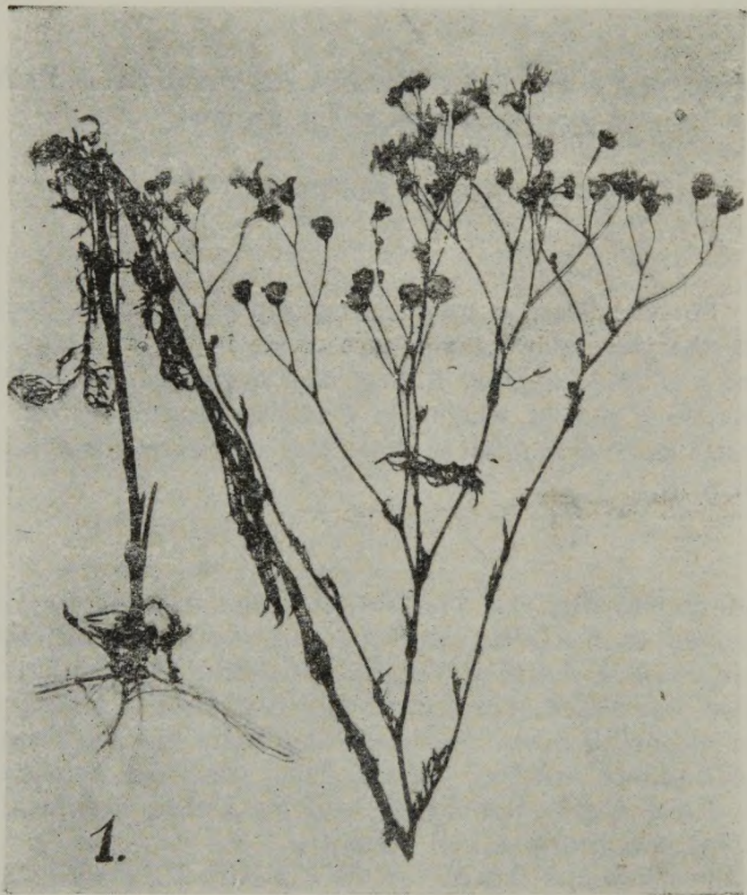
Fig. 1. Senecio borysthenicus Andrz. — aspectul plantei

Fructele (nucușoarele) sînt relativ mici, deabia ajungînd 2—2,5 mm lungime. Cele provenite de la florile marginale (ligulate), sînt complet glabre, lungi de 2,5 mm și au papusul cazător. Nucușoarele provenite din